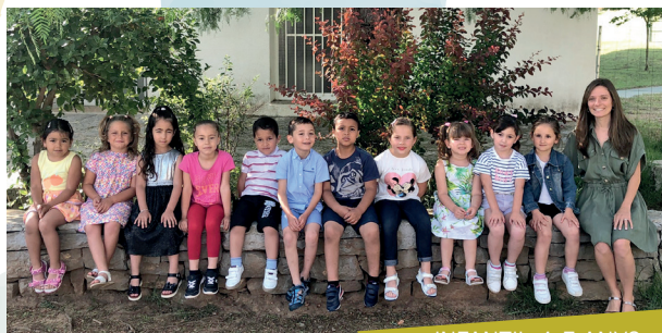
INFANTIL 4-5 ANYS