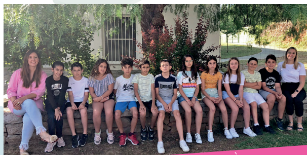
PRIMÀRIA 5é i 6é