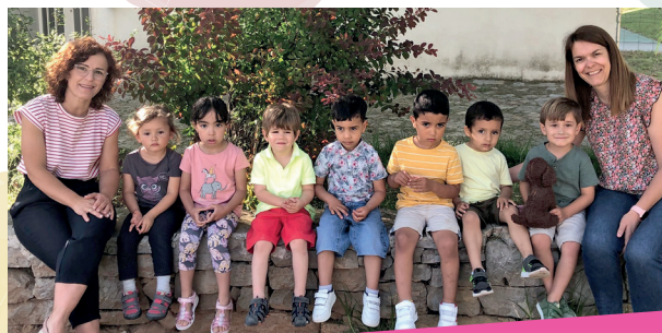
INFANTIL 3 ANYS