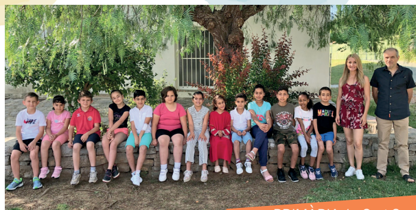
PRIMÀRIA 1r, 2n i 3r