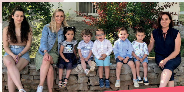
INFANTIL 2 ANYS

L'Associació de Mares i Pares del CEIP Albert Selma de Santa Magdalena vos convidem a sortir al carrer i gaudir de les nostres Festes Patronals. Recuperem abraçades, rialles i moments compartits, en uns dies que segurament seran inoblidables!